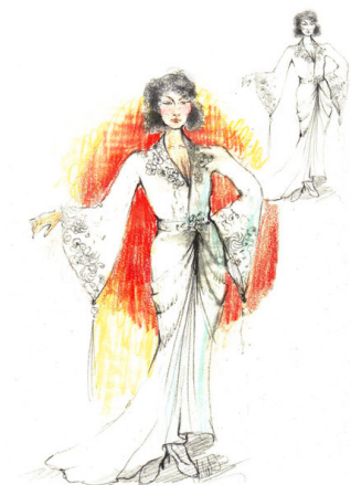
MUSIC-HALL COLETTE De Cléo Sénia Mise en scène Léna Bréban