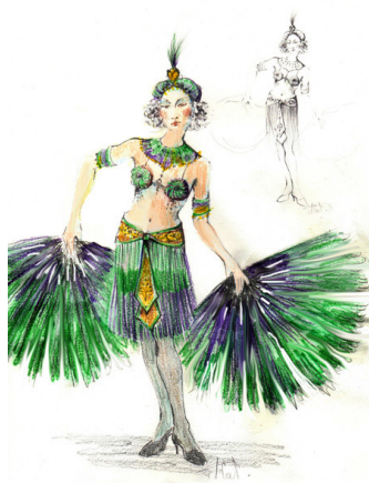
MUSIC-HALL COLETTE De Cléo Sénia Mise en scène Léna Bréban