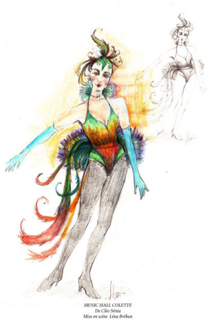
MUSIC-HALL COLETTE De Cléo Sénia Mise en scène Léna Bréban