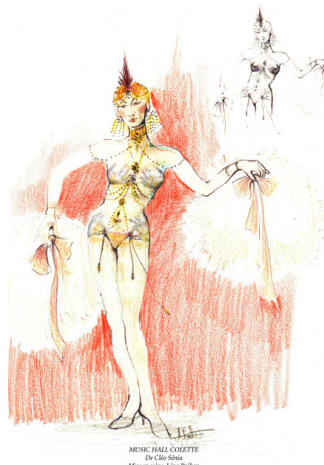
MUSIC-HALL COLETTE De Cléo Sénia Mise en scène Léna Bréban