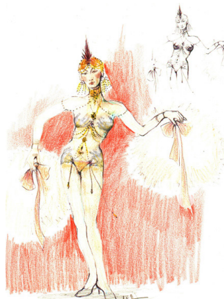
MUSIC-HALL COLETTE De Cléo Sénia Mise en scène Léna Bréban