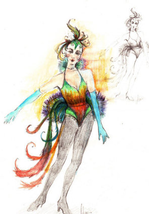
MUSIC-HALL COLETTE De Cléo Sénia Mise en scène Léna Bréban