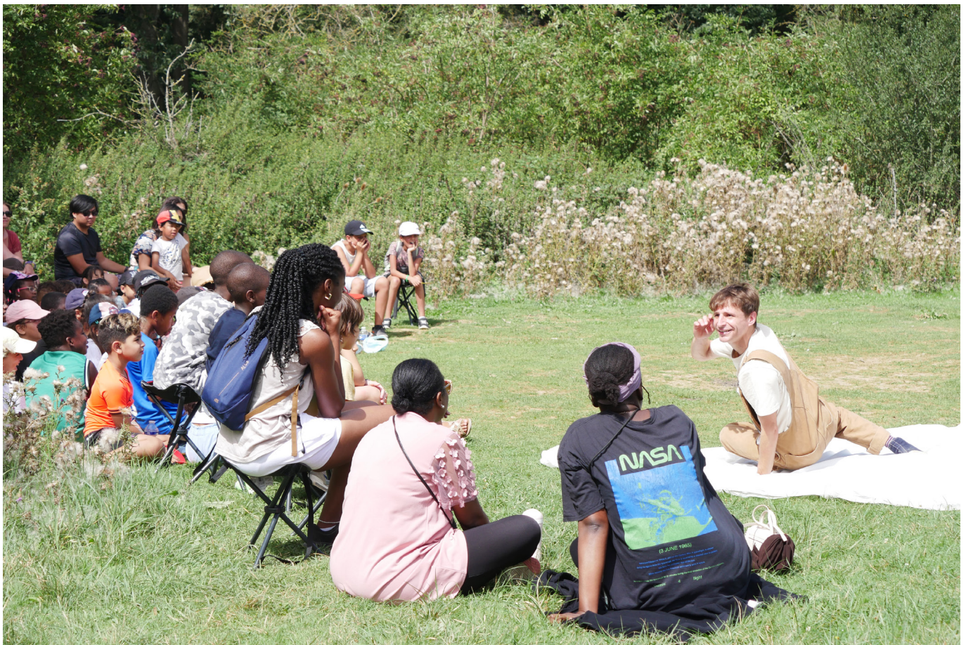
Représentation du Royaume de Kensuké lors de L'Île-de-France fête le théâtre, été 2023